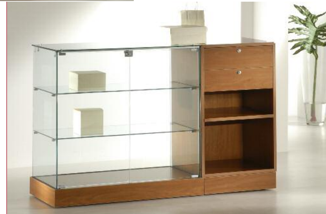
art. 162/M - (cm 50 x 46 x 90h)

Structure made of MDF in three standard colours: silver, wengè and cherry. On demand we could manufacture it in different colours or laquering.