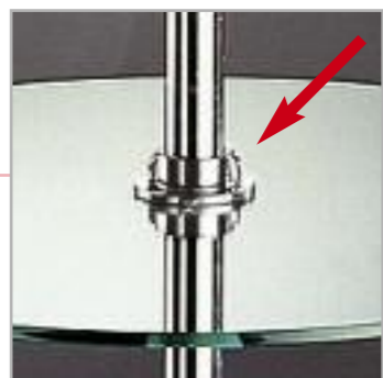
Art. RR Reggiripiano regolabile per piantana girevole Adjustable shelf holder for revolving pole