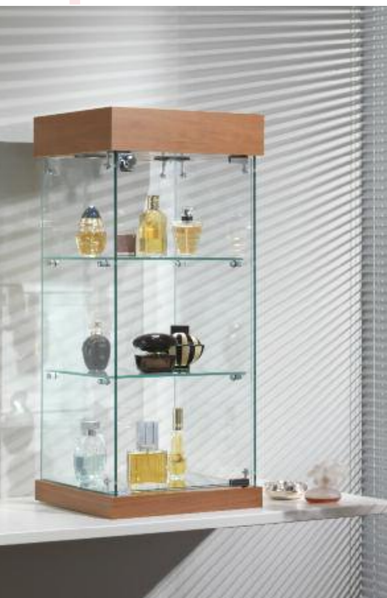
art. 201/Q - (cm 31 x 31 x 74h)

VETRINE DA BANCO SHOWCASES VITRINES VITRINEN