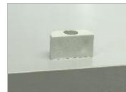
art. FA Ferma-antina Door stopper