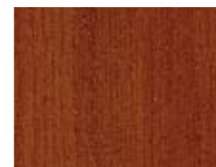
Ciliegio - Cherry-wood Cerisier - Kirsch