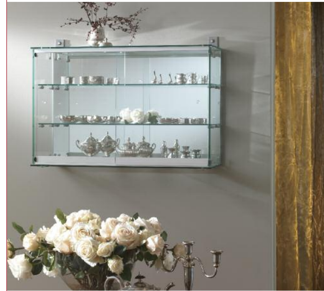
art. 200/F - (cm 78 x 25 x 55h)