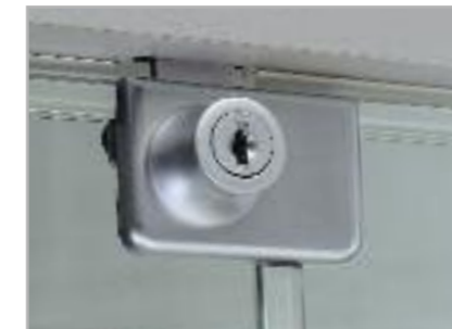
art. SA/2 Serratura antina doppia Lock for double door