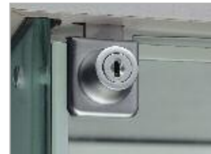
art. SA Serratura antina singola Lock for single door