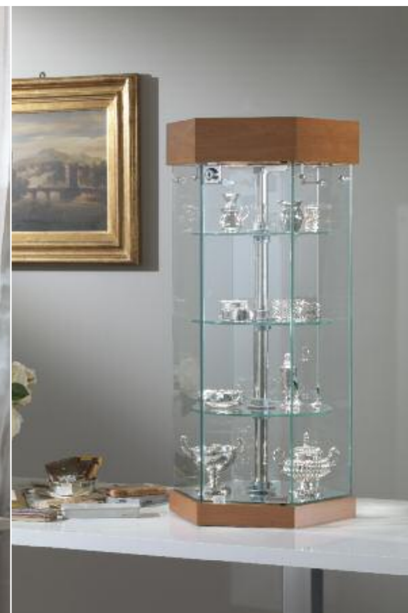
art. 221/ER - (cm Ø 36 x 74h)

Ripiani girevoli elettricamente Electric rotating shelves