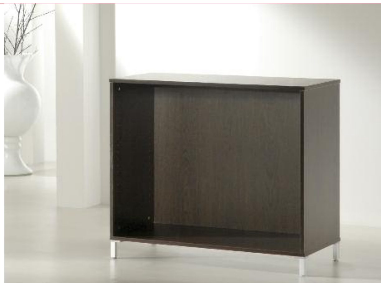
art. 50/B - (cm 100 x 46 x 90h)