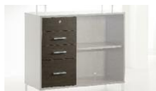
Art. 50/C Cassettiera - Drawers