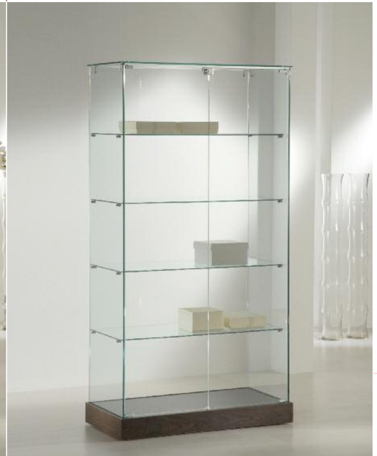
art. 130/CC - (cm 73 x 46 x 180h) art. 130/CS - (cm 93 x 46 x 180h)