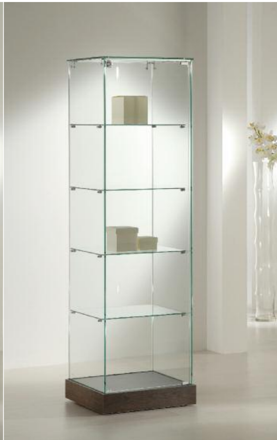
art. 180/ES - (cm 53 x 46 x 180h)