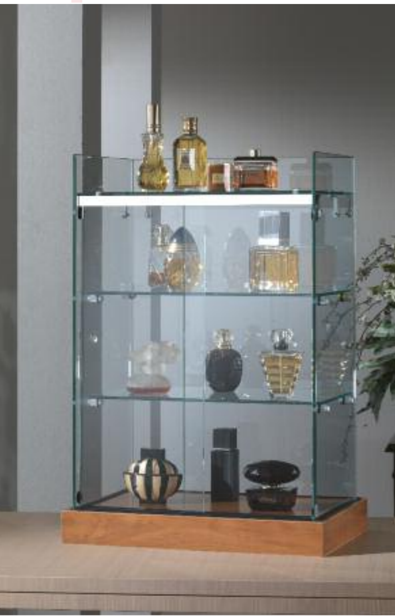
art. 190/F - (cm 40 x 27 x 60h)