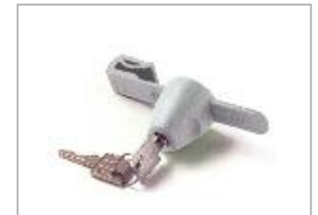
art. SC Serratura a cremagliera per ante scorrevoli Rack lock for sliding doors