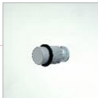
Art. RL Reggiripiano Shelf holder