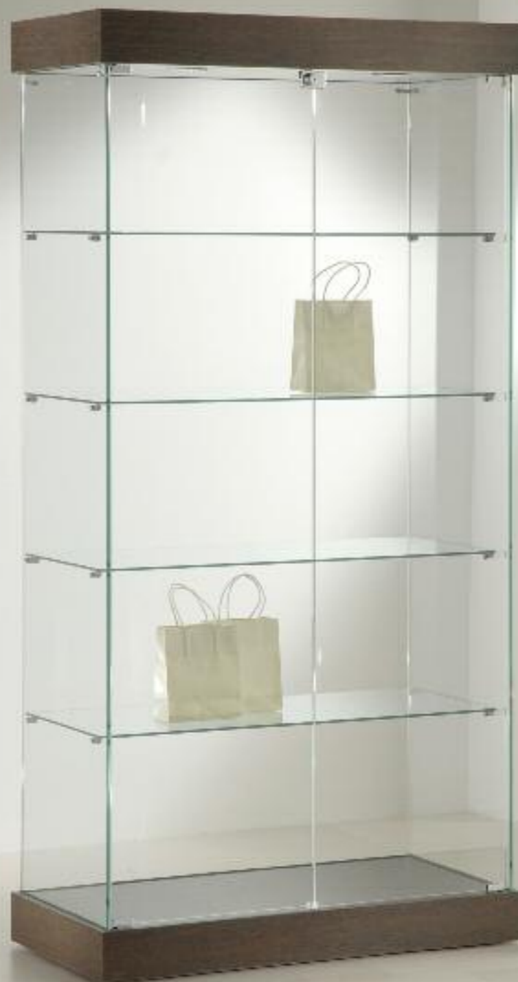
art. 131/CC - (cm 73 x 46 x 188h) art. 131/CS - (cm 93 x 46 x 188h)