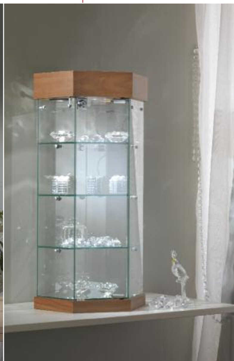
art. 221/E - (cm Ø 36 x 74h)

Ripiani girevoli elettricamente Electric rotating shelves