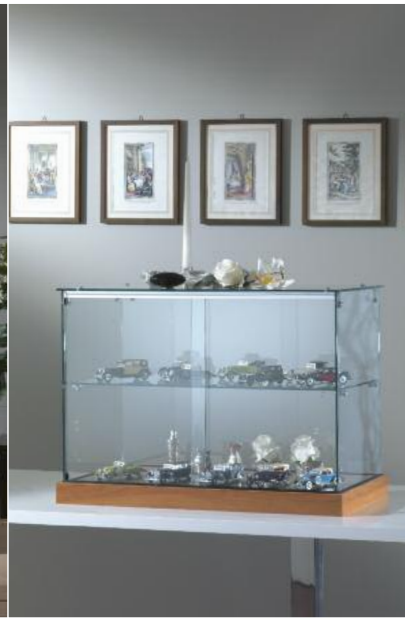
art. 190/B - (cm 71 x 35 x 50h)