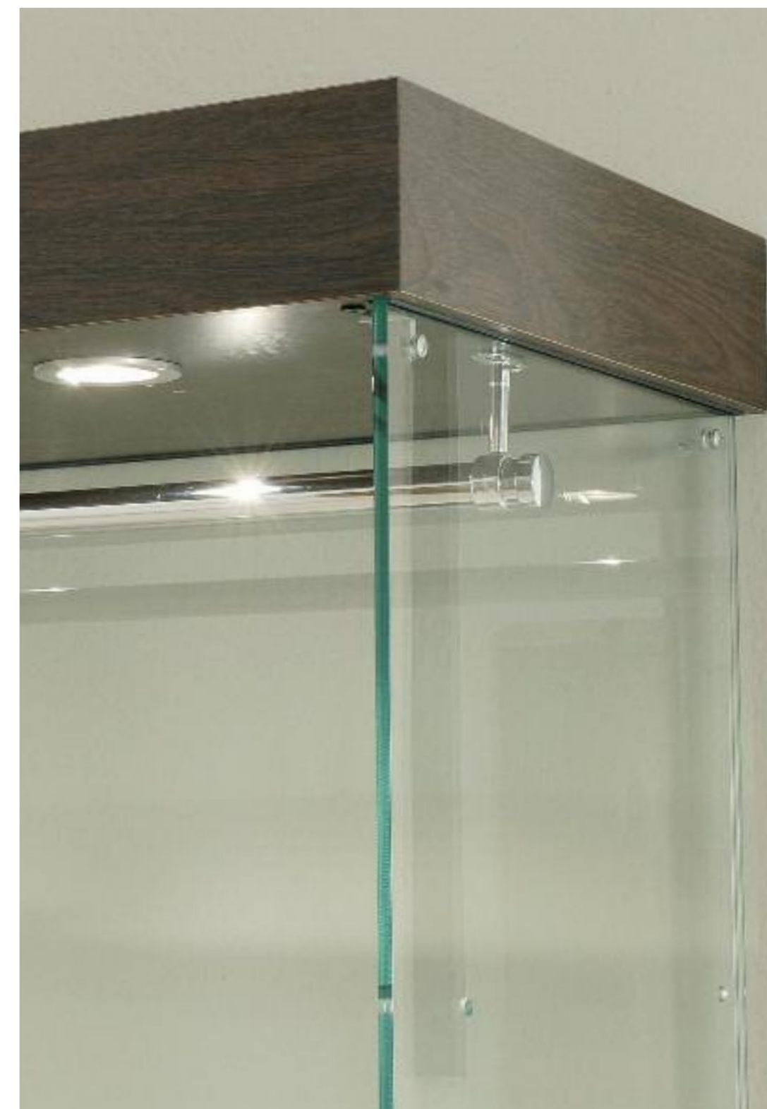
Dettaglio appendiabiti Detail of the clothes hanger bar