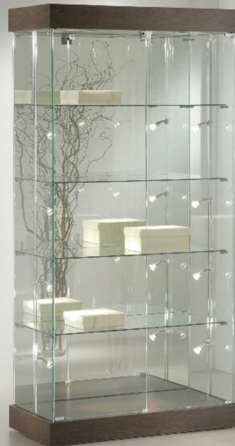
Esempio di art. 131/CC con schienale a specchio (art. 68/SP) e illuminazione laterale (art. 4/AV - 2 lati) Example of art. 131/CC with mirror back glass (art. 68/SP) and side lighting (art. 4/AV - 2 sides)