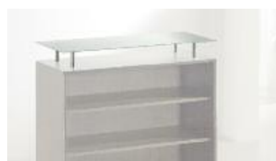
art. 50/TOP - Top in cristallo satinato - Glazed glass top