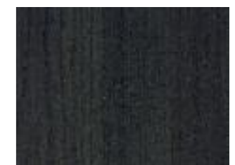
Wengè - Wengè Wengè - Wengè

I colori riportati in catalogo, per motivi di stampa, sono puramente indicativi The colours shown on our catalogue are just an example, because of printing reasons Les couleurs dans notre catalogue sont un exemple seulement a cause de motifs de impression Die auf unserem Katalog gezeichneten Farben sind wegen Druckgründe nur ein Beispiel