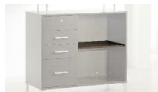
Art. 50/MC Mensola corta - Short shelf