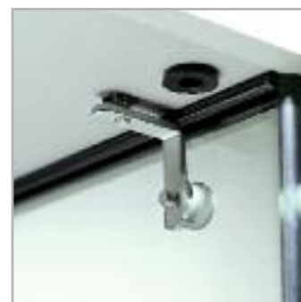
Art. 2/AP Angolare a 2 vie piatto 2-ways angular (flat)