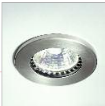
Art. 35/FA Faretto alogeno 35w Halogen spot light 35w