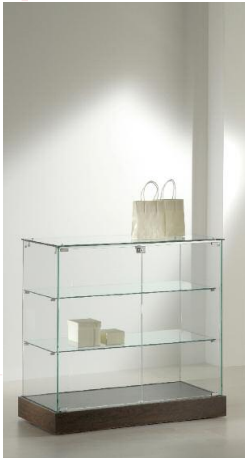
art. 20/AC - (cm 73 x 46 x 90h) art. 20/AS - (cm 93 x 46 x 90h)