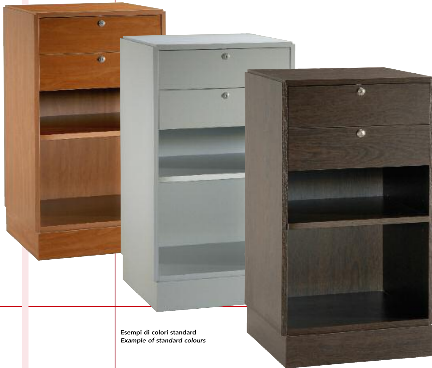
Esempi di colori standard Example of standard colours