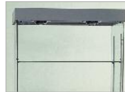
art. CR/92 - CR/140 - CR/180 Cremagliera per la regolazione dei ripiani Slide-system for mobile shelves