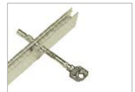
art. SS Serratura a spillo su binario per ante scorrevoli Pin lock on guide for sliding doors