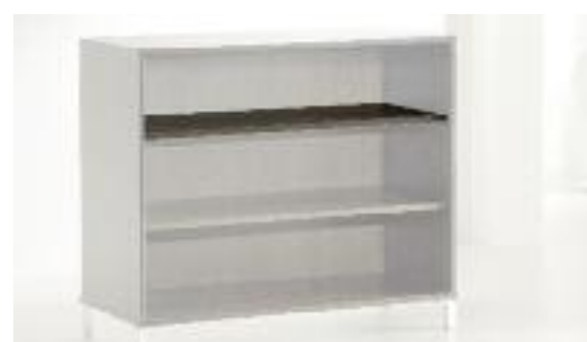
Art. 50/ML Mensola lunga - Long shelf