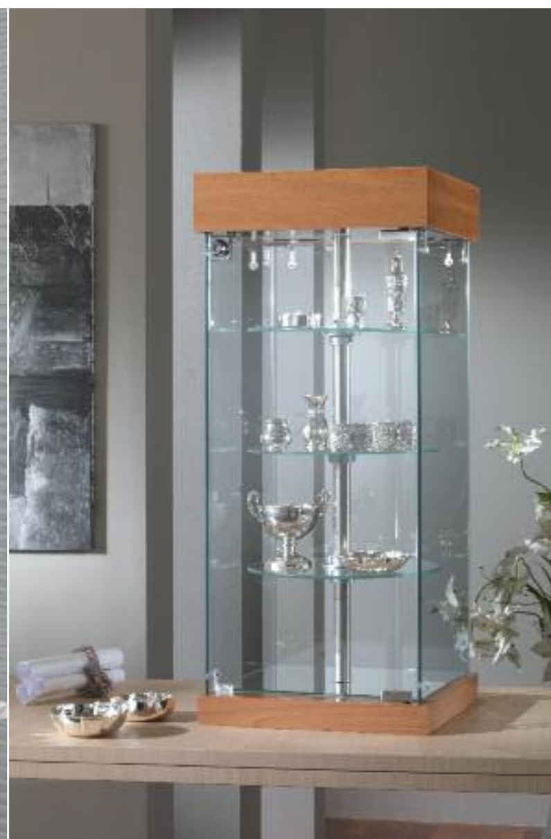
art. 201/RQ - (cm 31 x 31 x 74h)

Ripiani girevoli elettricamente Electric rotating shelves