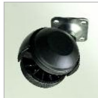
Art. RU Ruota -portata 80 Kg.- Castor -80 Kg. capacity-