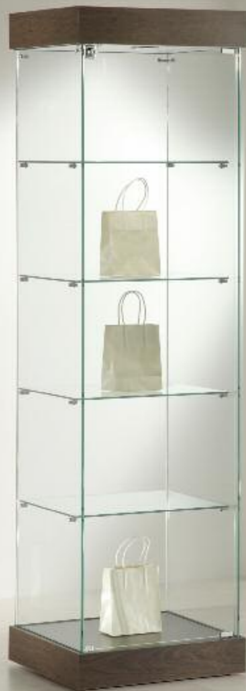
art. 181/ES - (cm 53 x 46 x 188h)

VETRINE SHOWCASES VITRINES VITRINEN H.188