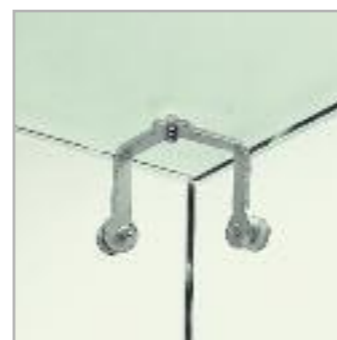
Art. 3/AN Angolare a 3 vie 3-ways angular