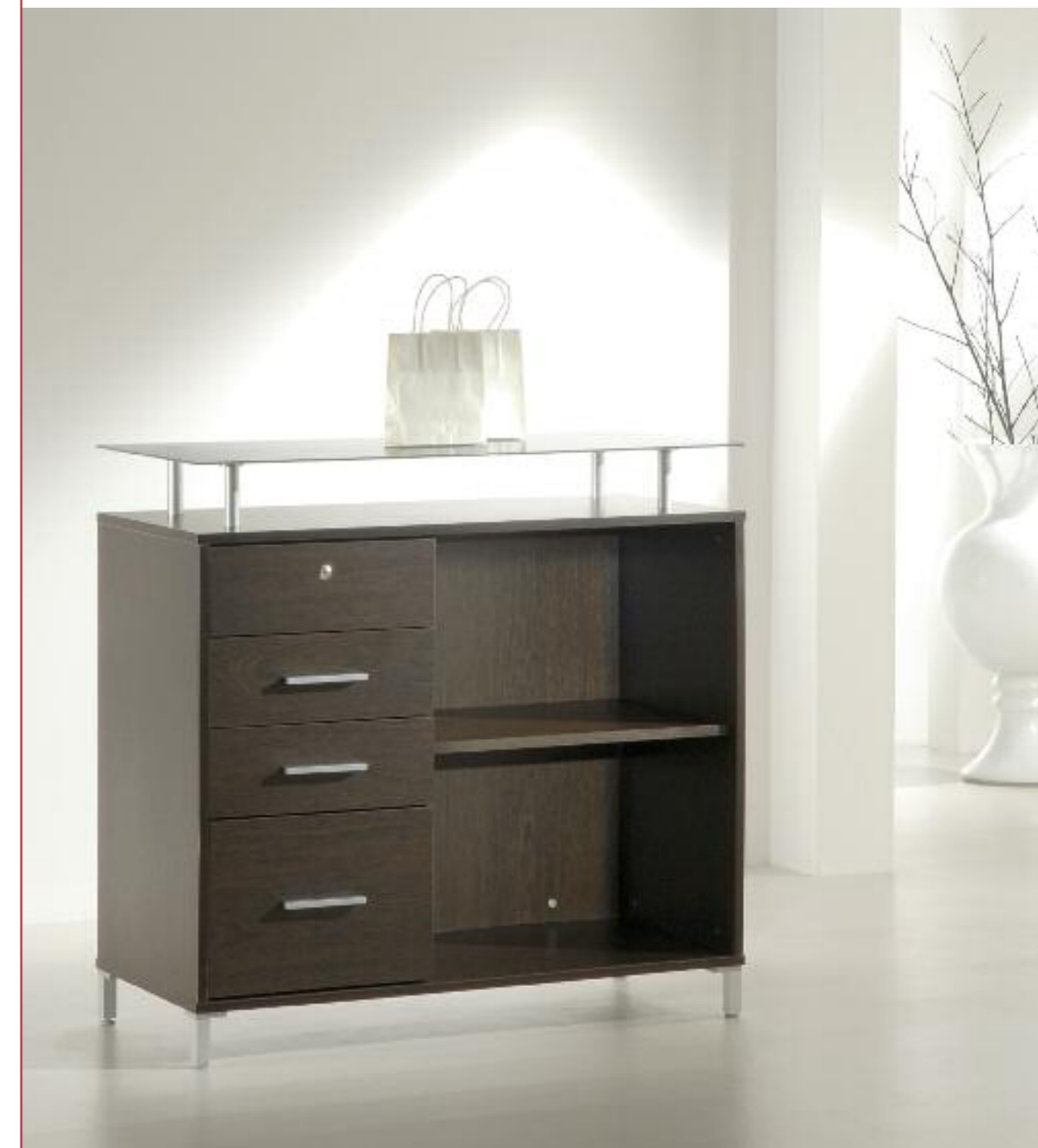
Esempio di composizione con art. 50/B + 50/TOP + 50/MC + 50/C Example of composition with models 50/B + 50/TOP + 50/MC + 50/C