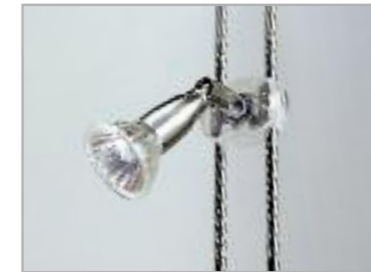
art. 1/AV Faretto alogeno per illuminazione singoli ripiani Halogen spot light to light up each single shelf