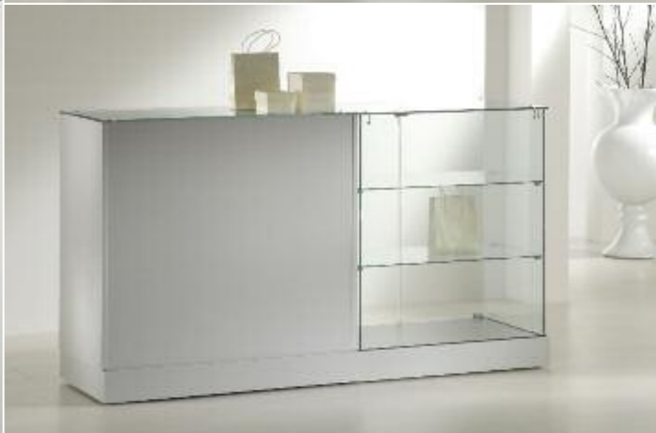
art. 162/MG - (cm 88 x 46 x 90h)