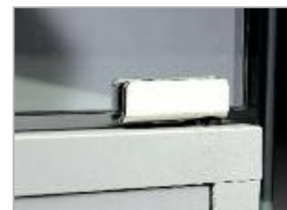
art. CE Cerniera Hinge