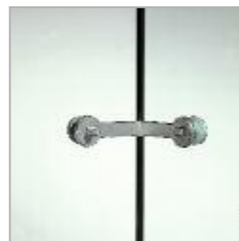
Art. 2/AN Angolare a 2 vie 2-ways angular