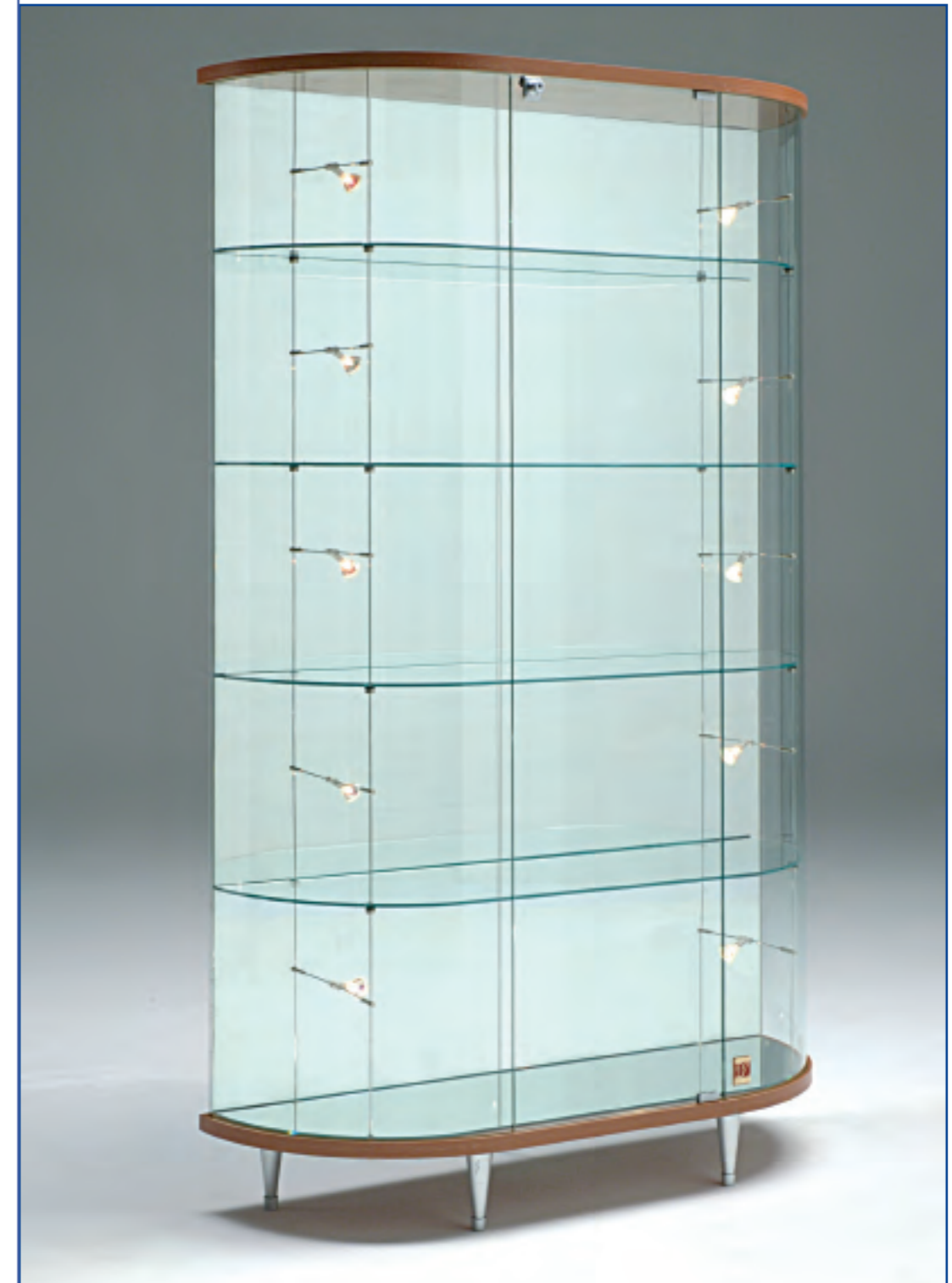
art. 211/M - (cm 111 x 38 x 190h)