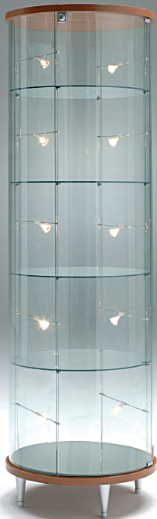
art. 211/RF - (cm Ø 55 x 190h)