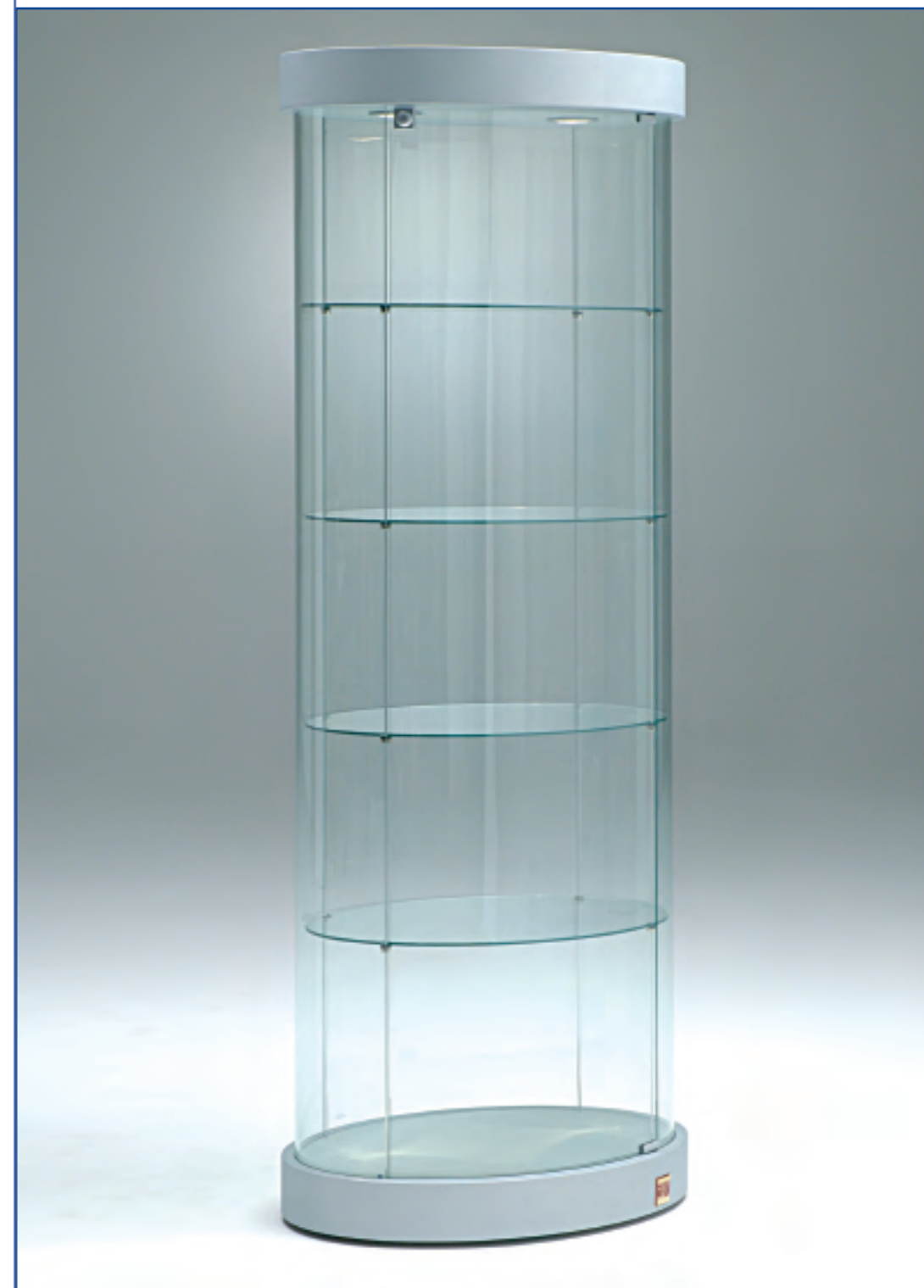
art. 221/OP - (cm 62 x 42 x 190h)

VETRINE SHOWCASES VITRINES VITRINEN H.190