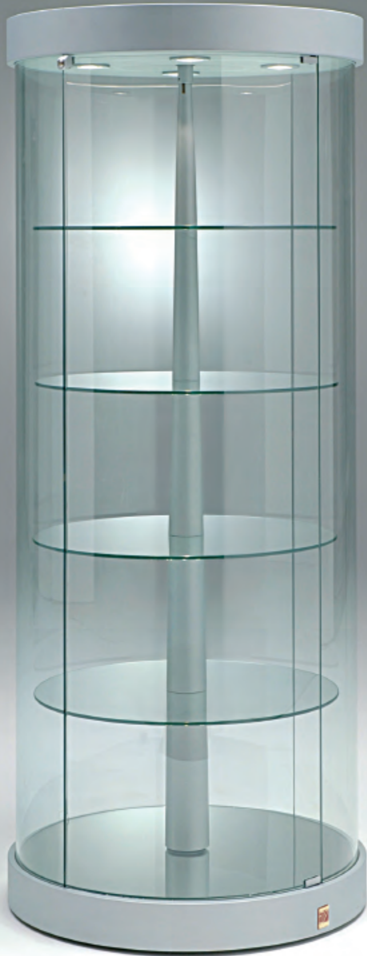
art. 221/RG - (cm Ø 71 x 190h)

VETRINE SHOWCASES VITRINES VITRINEN H.190