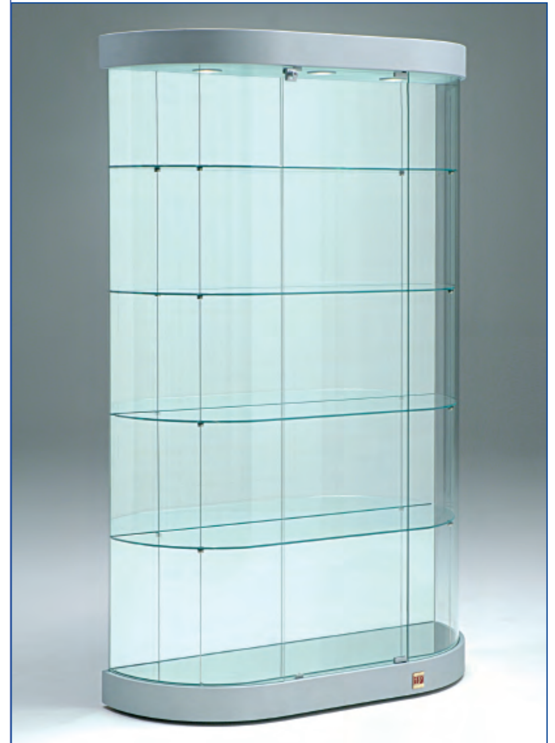
art. 221/M - (cm 111 x 38 x 190h)

Schienale a specchio - Mirror back glass