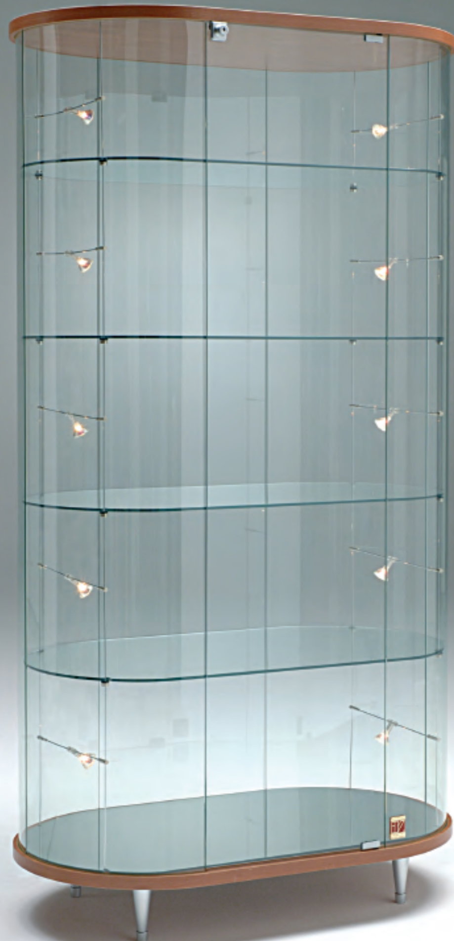
art. 211/OG - (cm 95 x 55 x 190h)

VETRINE SHOWCASES VITRINES VITRINEN H.190