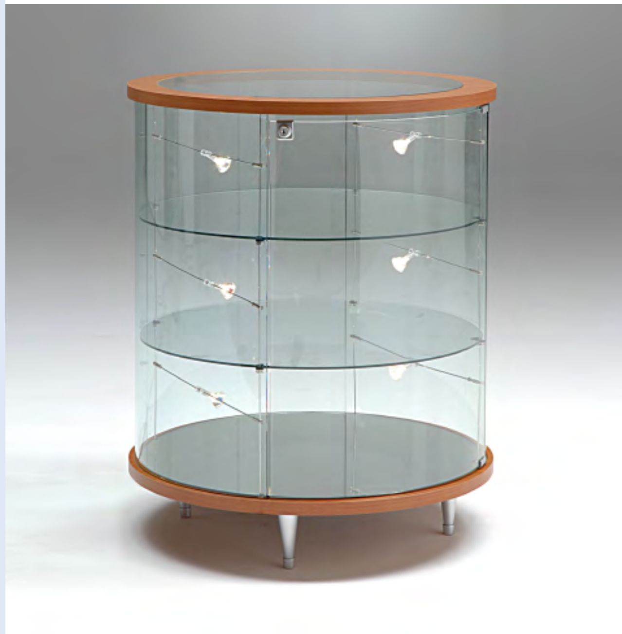
art. 211/B - (cm Ø 71 x 94h)

Le vetrine Top Line sono in cristallo temperato Top Line showcases are in tempered glass