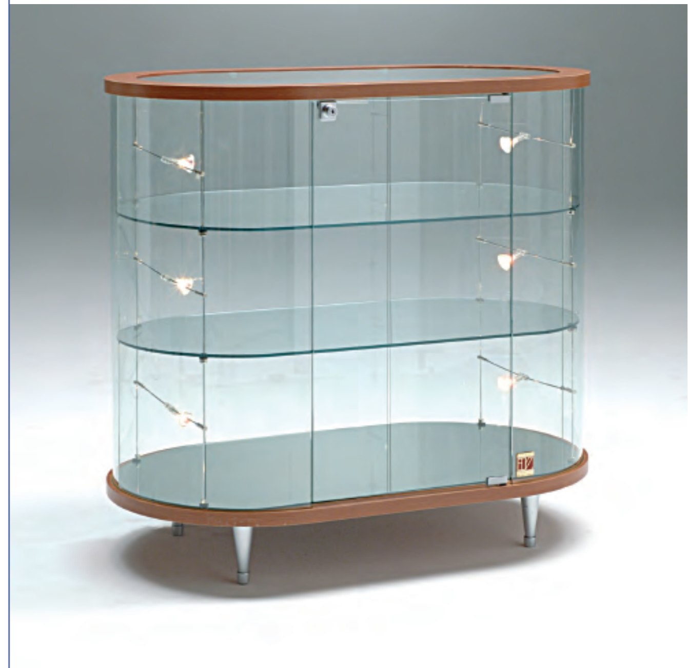
art. 211/OB - (cm 95 x 55 x 94h)