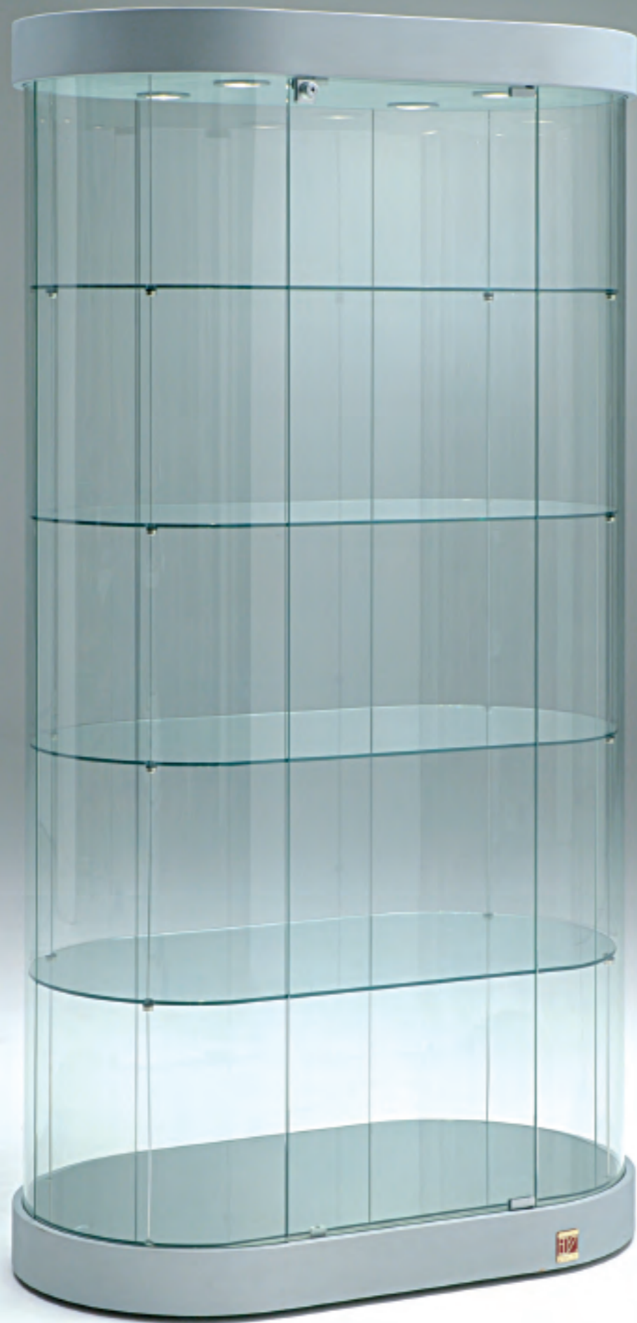
art. 221/OG - (cm 95 x 55 x 190h)