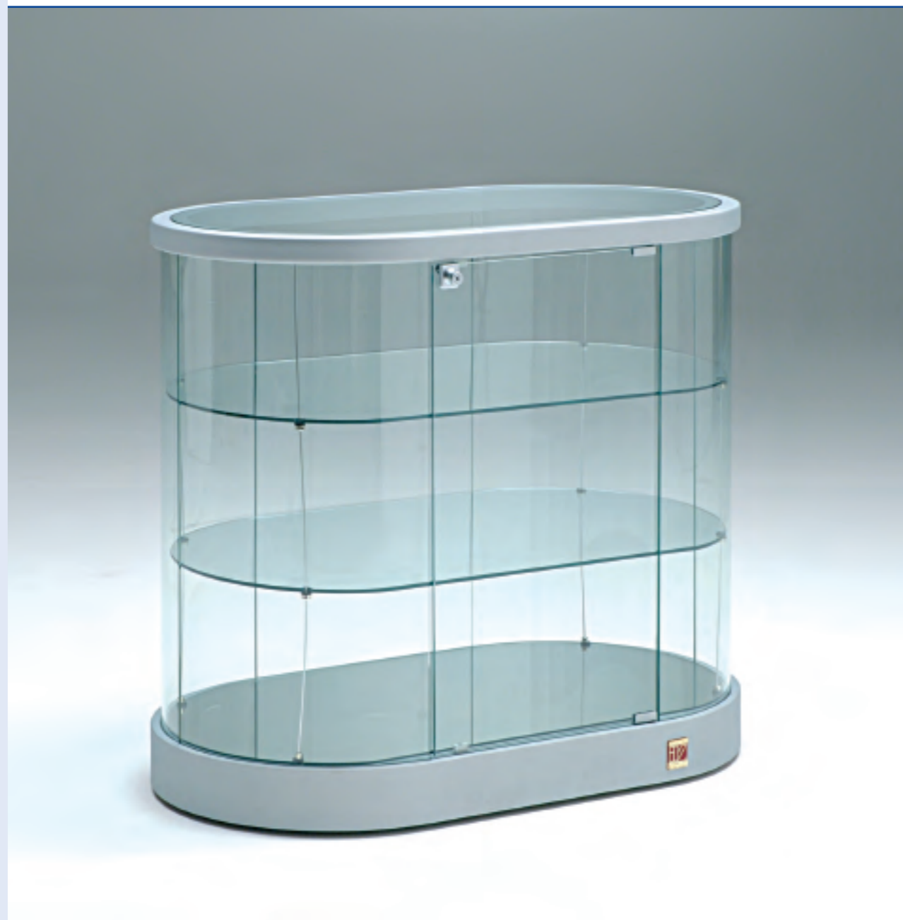
art. 221/OB - (cm 95 x 55 x 94h)

I colori riportati in catalogo, per motivi di stampa, sono puramente indicativi The colours shown on our catalogue are just an example, because of printing reasons Les couleurs dans notre catalogue sont un exemple seulement a cause de motifs de impression Die auf unserem Katalog gezeichneten Farben sind wegen Druckgründe nur ein Beispiel