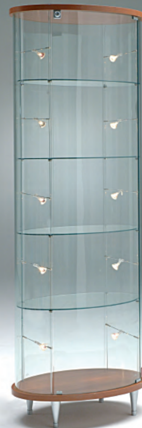
art. 211/OP - (cm 62 x 42 x 190h)

VETRINE SHOWCASES VITRINES VITRINEN H.190