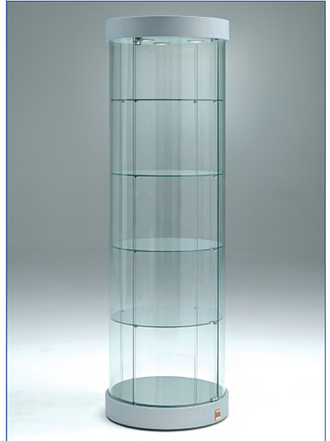
art. 221/RF - (cm Ø 55 x 190h)

Ripiani girevoli elettricamente - Electrical rotating shelves